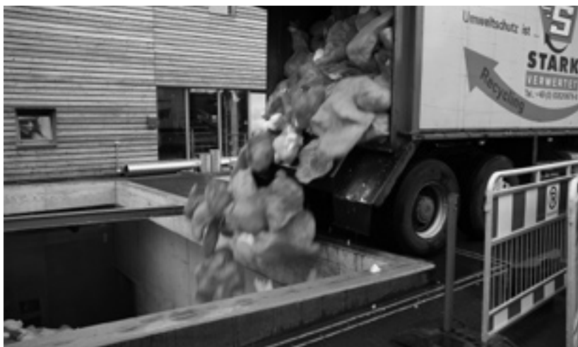
Einblicke in die Energiekette: Die Windeln werden angeliefert ...

auf 90 Prozent gebracht werden. Der Windelverbrennungsofen – von Mitarbeitern nur noch „Windel-Willi“ genannt – ist in seiner Art einmalig: Nach Vorgaben der Stiftung Liebenau, gebaut von der österreichischen Firma Mawera, kann er bis zu 5000 Tonnen so genannte Inkontinenzsystemabfälle (z.B. Windeln, Einmalhandschuhe, Zellstofftücher, Verbandmaterial etc.) pro Jahr verwerten. Die größte ökologische Herausforderung lag darin, die durch die Verbren-