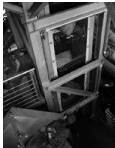
... über einen Paternoster auf eine Rampe gebracht ...