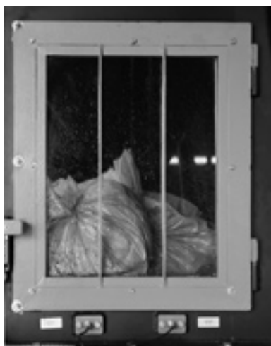
... die die Säcke direkt vor den Ofen bringt.

Von CO 2 -neutralen Brennstoffen spricht man, wenn die Menge an CO 2 , die bei der Verbrennung eines Brennstoffes freigesetzt wird, im nachwachsenden Brennstoff wieder eingebunden wird. Das heißt, das das aktuelle globale CO 2 -Gleichgewicht nicht verändert wird. Aus Pflanzen gewonnene, nicht-fossile Brennstoffe wie zum Beispiel Ethanol, Rapsöl und Holz bei nachhaltiger Erzeugung dieses Kriterium erfüllen, gelten sie als CO 2 -neutral. Heizen mit Holz, Holzpellets und Zellstoffen ist Heizen im Kreislauf der Natur.