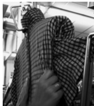
... das nach 300 Metern schließlich als Wasserdampf zum Beispiel am Hemdenfinisher ...