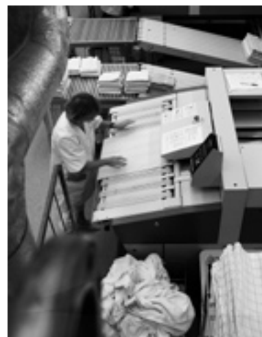
... oder an der Mangel verwendet wird.